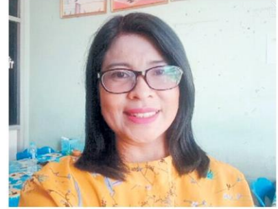
สายฝน แสงแก้ว

ซึ่งการบริโภคนมนอกจากจะส่งเสริมสุขภาพที่ดีแล้ว ยังเป็นส่วนสำคัญในการสร้างความเข้มแข็งให้กับเกษตรกรโคนมไทยอีกทางหนึ่งด้วย